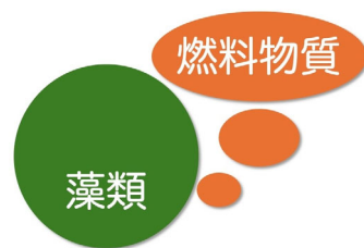
燃料物質の細胞外生産法 (イメージ)