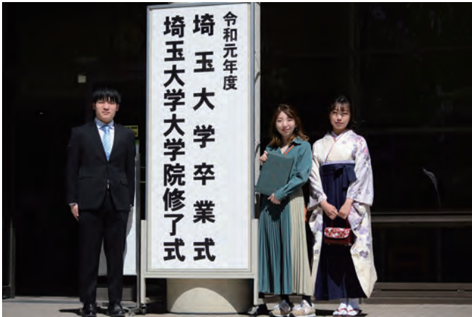
▲大学会館前で記念撮影

例年のように、学部生全員が集まることは叶いませんでしたが、キャンパスでは、卒業生たちが満開の桜の下、久しぶりに会う友人同士で、お互いの新たな門出を祝う様子が見られました。