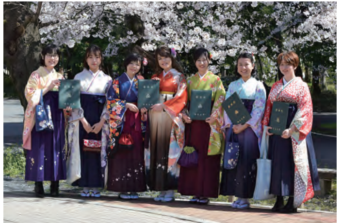
▲桜の下で新たな門出を祝う卒業生