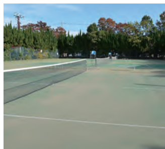
▲改修が完了したテニスコート