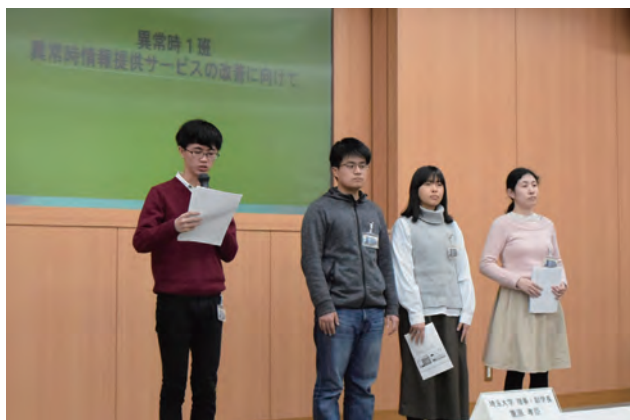
▲学生グループの提案発表の様子

本学とJR東日本大宮支社は、2015年8月より双方が有する人的・物質資源を有効活用することで、埼玉大学周辺および埼玉県を中心としたJR東日本沿線地域の持続的発展と人材育成に寄与する目的で連携協定を締結しており、このプログラムはその取組の1つとして実施しています。