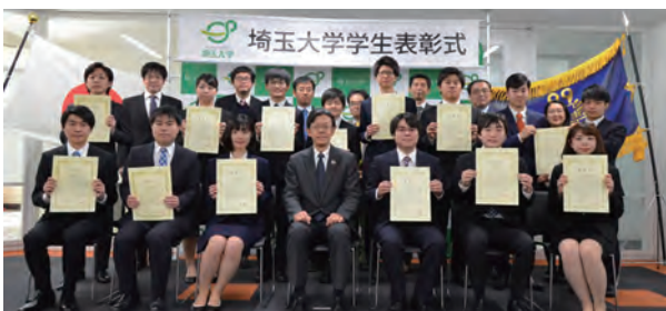
▲山口 前学長(前列中央)と表彰された学生たち