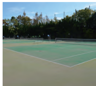
▲全12面のコートが改修されました