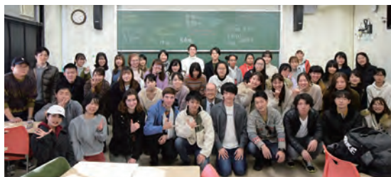
◀講義に参加した学生たち。ディスカッション・発表を通じて学生同士の交流が深まりました

ディスカッション後には、各留学生が出身国の正月の風習を紹介。台湾の餃子や火鍋、韓国のトックを食べる文化など、紹介された内容に学生たちも興味津々で、自国の文化と似ているところを見つけて共感したり、独特の風習に驚いたり、異文化交流を楽しみました。