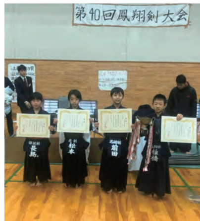
▲小学生低学年の部で入賞した子供たち

また本学剣道部員にとっても、地域の道場や小学校、中学校、高等学校の剣道部の顧問の先生方に監査してもらうことで、審査技術の向上を図れる貴重な機会になりました。