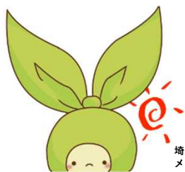
埼玉大学マスコットキャラクター メリンちゃん

日 程：各コース全て2日間 開催時間：13:00～17:00 定 員：各コース15名 受講料：500円（当日集金）