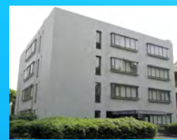
◀ 科学分析支援センター